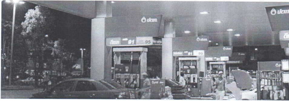
ราคาขายปลีกภูมิภาค